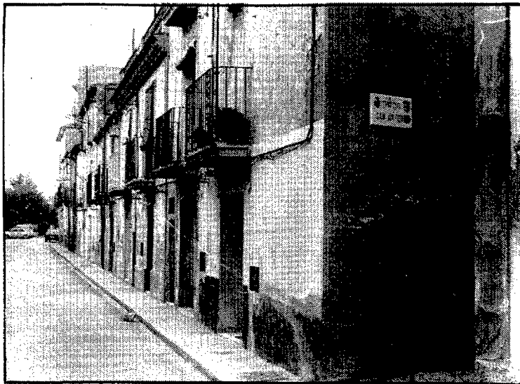
Les cases de planta baixa i un pis, per als treballadors de la fàbrica, van ser les primeres construccions del barri.

Finament, l'adjudicatari de la subvenció, acabada l'activitat, haurà de justificar documentalment la utilització del fons per a les activitats previstes i haurà d'acompanyar aquests documents amb una memòria detallada especificant si s'han assolit els objectius pretesos.