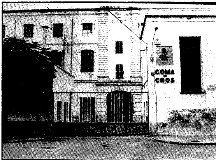
La Coma Cros, juntament amb la Mollerres, van ser l'origen del barri.