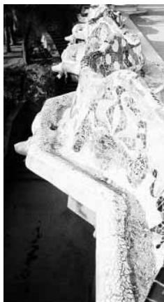
PEREZ DE ROZAS

dimensión, unas 17 hectáreas, propicia situaciones muy distintas. Aunque en principio sus características físicas precisamente facilitan la recepción de gran cantidad de público, al propio tiempo genera otro tipo de conflictos; los derivados de un mal comportamiento son los más graves y preocupantes. Dicho esto, cabe preguntarse la razón por la que no se ha incrementado la vigilancia, que debería ser proporcional al mayor número de visitantes. No puede ser que una obra, que mereció desde un buen principio ser incluida en el honorífico catálogo del patrimonio de la humanidad, se abandone a su suerte y que cualquier especie de gamberro pueda campar a sus anchas, tal