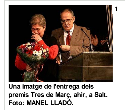
Una imatge de l'entrega dels premis Tres de Març, ahir, a Salt.

Darrera actualització ( Dijous, 4 de març del 2010 02:00 )