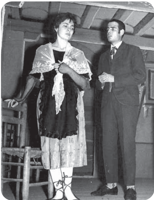
La puntaire de la Corta 1961