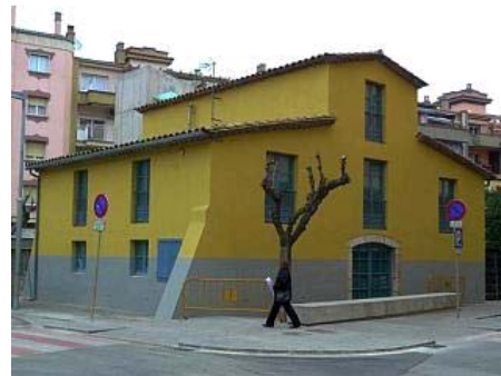
La reforma recupera l'immoble de la plaça Catalunya de Salt. pere quero

Anys abans, el Mas Mota havia estat en perill, ja que l'any 1979, quan Salt estava annexonat a Girona, hi havia un projecte per enderrocar-lo i adequar l'espai com a zona verda.