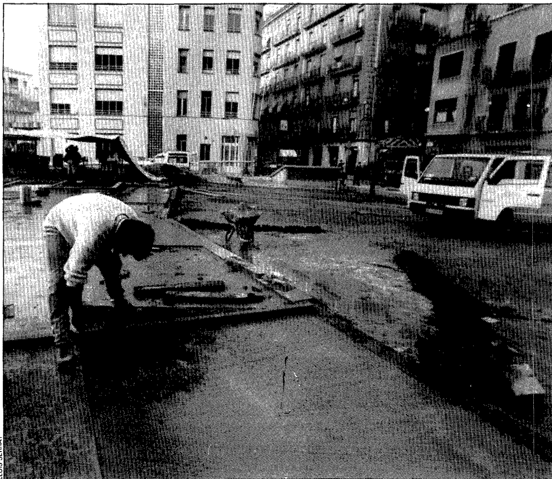
Vista de les obres que s'estan fent actualment a la plaça de la Constitució.

L'obra només quedarà per pavimentar el solar situat entre aquest carrer i l'església del Mercadal, però primer caldrà arribar a un acord amb els propietaris i inquilins de l'immoble que encara queda en peu. De moment, les negociacions estan aturades, ja que, si bé l'Ajuntament està disposat a pagar els milions que li demanen, exigeix que l'edifici quedi totalment lliure el mes de juny, cosa que no és acceptada pels estadants actuals de l'immoble, on hi ha una oficina i dos habitatges. El paviment de la plaça de la Constitució es fa bàsicament amb peces de formigó, convertint-la així en una de les anomenades dures. Això ha estat criticat per alguns ciutadans, mentre que l'oposició municipal ha criticat també el cost elevat del projecte. /P.M.