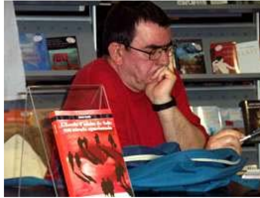
El llibre i l'autor