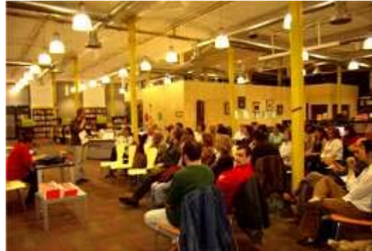
Una imatge de la Kropotkin, amb els assistents a la presentació del llibre de Parra

teva, la sensibilitat d'algun lector o lectora o de les persones interessades.»