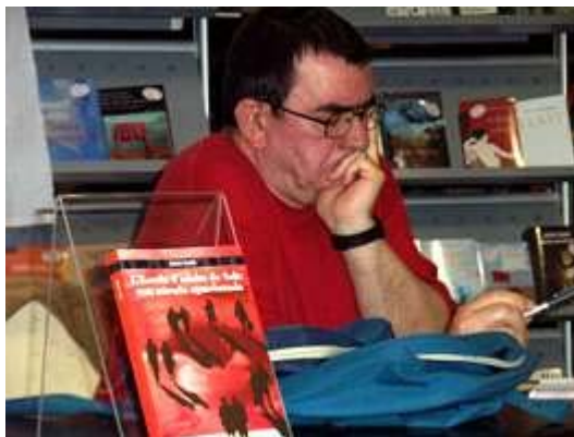
El llibre i l'autor a la Biblioteca de Salt

extraordinària i una mostra, difícil de trobar, de la millor pedagogia.