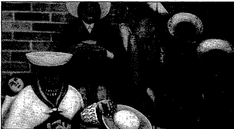
«Licor d'arròs» de Josep Ramis

Galeria d'Art Vidreres. (C/ Catalunya, 11). Horari: tarda de 7 a 10: Jordi Gendra, aquarel·les. Des del 16 fins al 29 de juliol.