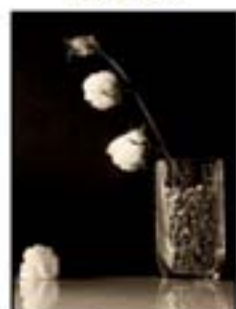
1r premi. Albert Sarola.

2on Concurs de fotografia FotoNius'03 30-9-2003